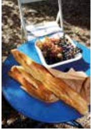
Barbara Eckholdt – pixelio.de